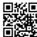
詳細は公式HPをご確認ください。

日時 9/9(土) 16:00~17:30 対象 高校生以上(起業する方、創業している方) 定員 30人(先着順) 会場 あだち産業センター3階 交流室